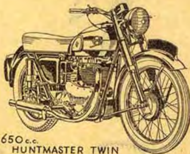
650 cc. HUNTMAS-TER TWIN

650 cm 3 — F. H. "Huntmaster" 646 cm 3 , 70 × 84 — Puissance fiscale 7 CV — Taux compression 7,25 à 1 — 40 HP à 6.000 t/m — Rappports B. V. solo 4,35, 5,70, 7,40, 11,55 — Side-car 4,73, 6,19, 8,04, 12,35 — Pneus AV 3,25 × 19, AR 3,50 × 19 — 186 kgs — 165 km/h ..... 360.000 Frs