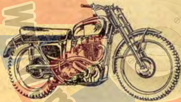
500 c.c. H. S. CROSS

500 cm 3 — H. S. Cross 497 cm 3 , 81,8 x 95 — Taux compression 9,1 à 1 — 34 HP à 6.000 t/m — Rappports B.V. 6,02, 7,9, 10,2, 16,1 — Pneus sport AV 3,00 x 21, AR 4,00 x 19 — 144 kgs 360.000 Frs