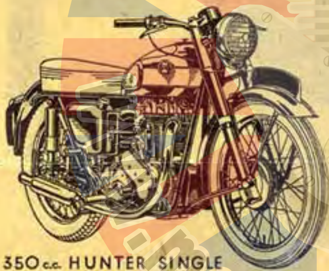
350 cc. HUNTER SINGLE