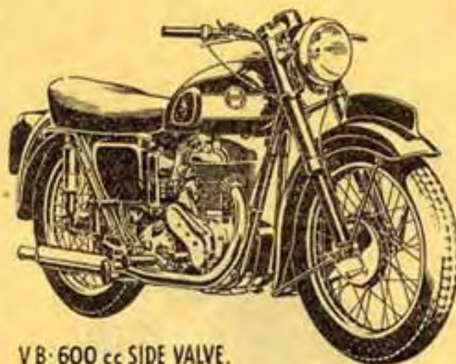
V.B. 600 cc SIDE VALVE.

Supplément : Suspension AR intégrale oscillante, à amortisseur hydraulique type "voiture" ..... 25.000 Frs