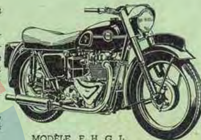
MODÈLE F. H. G. L.

MODÈLE GRAND LUXE SPORT K. H. G. L. — Freins-moyeux centraux, tambours aluminium chemisés à ailettes de refroidissement, 178 mm. de diamètre, 38 mm. de largeur — Carter de chaîne secondaire étanche — Carenage de phare aérodynamique avec visière de protection — Ampèremètre, compteur de vitesse et interrupteur d'éclairage encastés dans un tableau de bord profilé avec le carenage du phare — Nouvel écusson et motifs chromés démontables sur réservoir d'essence. Présentation noir et chrome .... 350.000 Frs