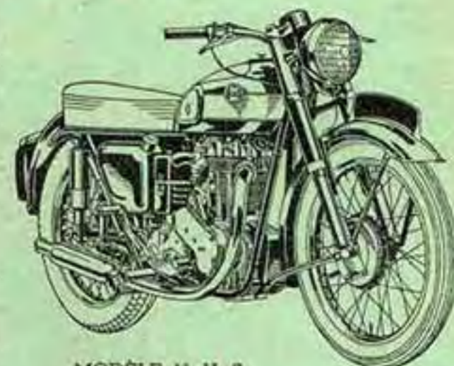
MODÈLE N. H. S.

Moteur : 1 Cylindre vertical 4 temps — Soupapes culbutées — Paliers de vilebrequins à grand diamètre — Piston en alliage d'aluminium à jupe fendue avec segment supérieur en "Vachrome" — Carburateur Amal "Monobloc" avec filtre à air donnant des performances supérieures. Boîte de Vitesse : Boîte 4 vitesses commandées par sélecteur au pied à verrouillage automatique — Rapports B. V. variables (solo ou side-car). Transmission : par chaînes sous carter — Embrayage à disques multiples. Allumage : par magdyno — Avance réglable à main. Cadre : Fourche AV télescopique à amortisseurs hydrauliques — Cadre à double berceau équipé d'une suspension AR intégrale oscillante à amortisseur télescopique hydraulique type "voiture" — Pattes d'attache de side-car incorporées — Réservoir essence 18 litres, huile 3,5 litres. Présentation : Emaille bordeaux foncé, filets or, avec bandes réservoir chromées, écusson moderne réalisé en plastique "3 dimensions".