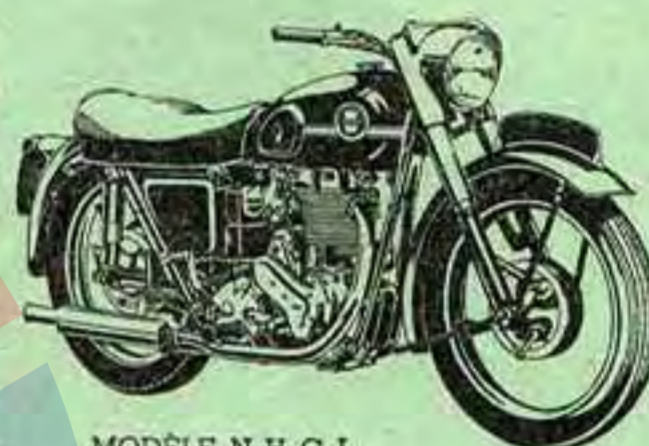
MODÈLE N. H. G. L.

MODÈLE GRAND LUXE SPORT N. H. G. L. : Culasse en Aluminium — Taux de compression 7,5 à 1 — Soupapes en tête commandées par tiges-poussoirs complètement enfermées — Freins-moyeux centraux, tambours aluminium chemisés à ailettes de refroidissement, 178 mm. de diamètre, 38 mm. de largeur — Carter de chaîne secondaire étanche — Carenage de phare aérodynamique avec visière de protection — Ampèremètre, compteur de vitesse et interrupteur d'éclairage encastres dans un tableau de bord profilé avec le carenage du phare — Nouvel écusson et motifs chromés démontables sur réservoir d'essence .... 295.000 Frs