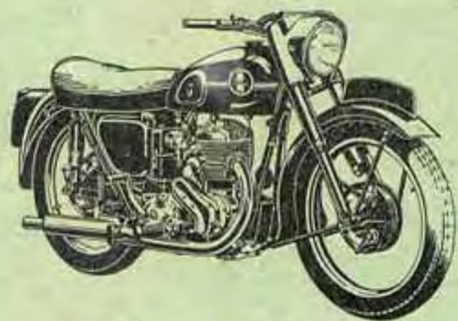
MODÈLE V. B. G. L.

Moteur : 1 Cylindre vertical 4 temps — Soupapes latérales — Culasse aluminium polie intérieurement — Vilebrequin à contre-poids — Paliers sur roulement — Piston alliage aluminium à jupe fendue avec segment supérieur en "Vachrome" — Carburateur Amal "Monobloc" avec filtre à air donnant des performances supérieures. Boîte de Vitesse : Boîte 4 vitesses sous carter commandées par sélecteur au pied à verrouillage automatique — Rapports BV variables (solo ou side-car). Transmission : par chaînes sous carter — Embrayage à disques. Allumage : par magdyno — Avance réglable à main — Eclairage par dynamo à régulateur de débit. Cadre : Fourche AV télescopique à amortisseurs hydrauliques — Suspension AR intégrale oscillante à amortisseur télescopique hydraulique type "voiture" — Pattes d'attache de side-car incorporées — Réservoir essence de 18 litres, huile 3,5 litres. Présentation : Emaille bordeaux foncé, filets or, avec bandes réservoir chromées, écusson moderne réalisé en plastique "3 dimensions".